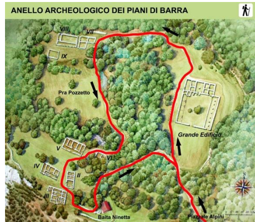
Rondwandeling over de site

Na de Piani di Alpini volgt, iets hoger gelegen, het bezoekerscentrum Eremo , een hotel en het Archeologisch Museum. Hier lag de kerk en het klooster van de franciscanen ('Eremo' betekent kluizenaarsverblijf). Het klooster was omgeven door een dicht beukenbos dat het tegen de koude winden beschermdde. Hierboven heb ik de geschiedenis van het klooster en van het laatgotische kerkje van S. Maria al beschreven.