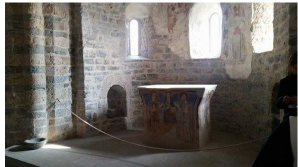
Buitenaanzicht van de abdij van S. Pietro al Monte en foto van het interieur van de apsis