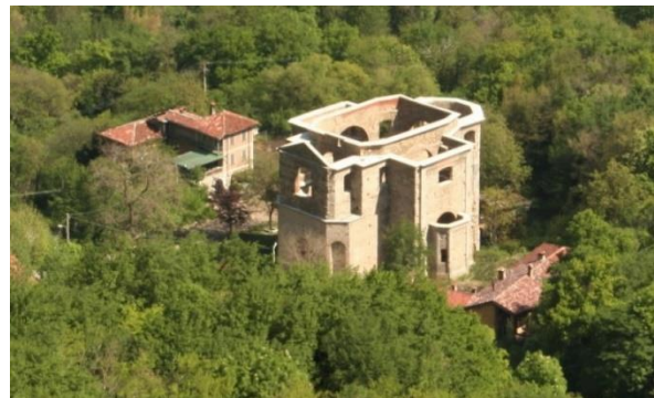
Luchtfoto van de kerk van San Michele

Als u links van het kerkje het voetpad neemt dat omlaaggaat, midden tussen de huizen door, dan bereikt u na ca 5 minuten een top met een kapelletje, vanwaar u een schitterend panorama heeft op Lecco en de twee meren van de Adda aan de zuidkant van de stad. Vanhier gaan we terug naar het kerkje en dan is er een alternatieve route terug. Rechts, na het huis, staat een grote richtingwijzer in de vorm van een kurk naar ‘Baite Alpini’. Het pad loopt omlaag en komt al snel bij een oude ‘lavatoio’, een wasplaats, en een waterplas. Het pad gaat verder omlaag en gaat over een houten bruggetje, waarna het weer stijgt door het bos. Daarna bereiken we de uitspanning met tafeltjes buiten. Na nog ongeveer 5 min dalen komen we bij de afscheidingsboom en daarna bij ons vertrekpunt.