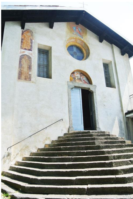
Het kerkje van Sint Maria al Barro (links) en rechts de afbeelding van santa Maria degli angeli in deze kerk