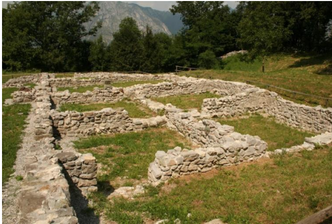
Archeologische opgravingen op de Piani Alpini