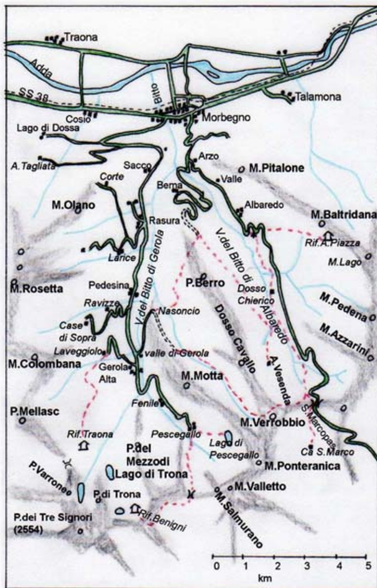
Kaart van de dalen van de Bitto