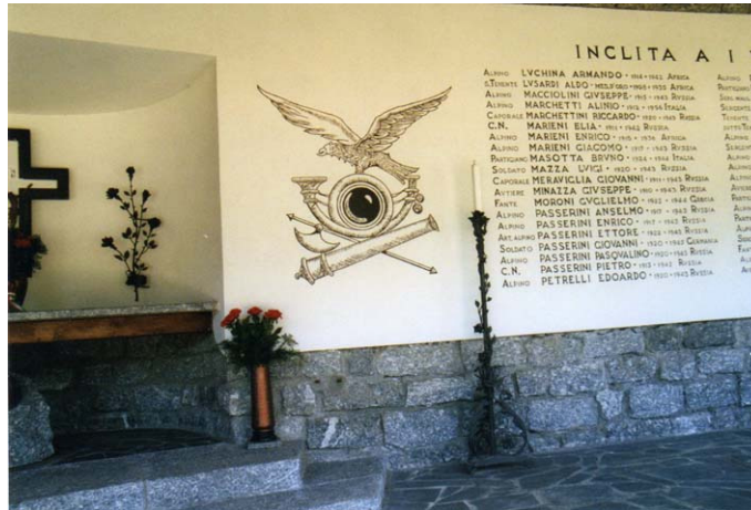
Monument voor de in Rusland gesneuvelden in de 2 e wereldoorlog

monument, gebouwd in 1962, dat herinnert aan de meer dan honderd inwoners van Morbegno die in de tweede wereldoorlog sneuvelde, vooral in januari 1943 tijdens de terugtocht uit Rusland. Vanaf deze plaats heeft men een schitterend uitzicht over Morbegno en het Valtellina.