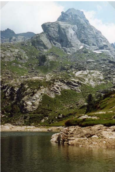
Het stuwmeer Lago di Pescegallo (1865 m)