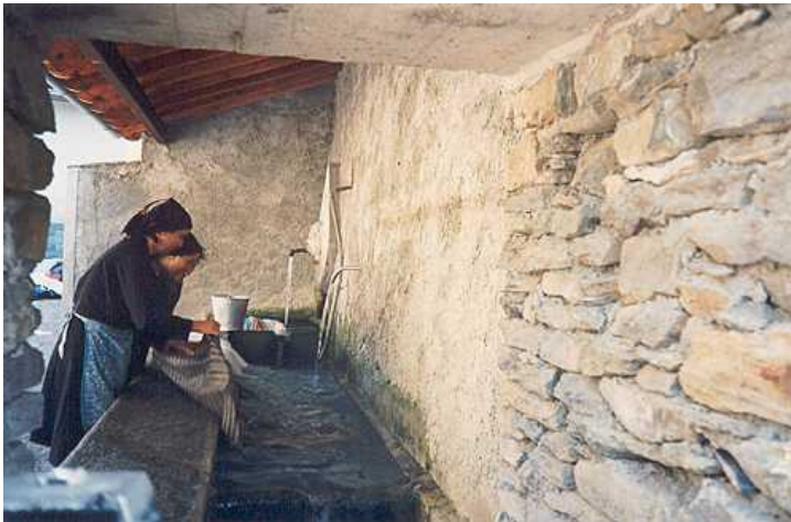
Wasplaats in Albaredo

De huizen van het dorp liggen tegen een vrij steile helling. Bij de Porta del Parco di Albaredo, in het dorp, is een informatiecentrum. Veel in het dorp herinnert aan de nauwe banden met Venetië: het S. Marcoplein in het centrum met een grote schildering en vóór de kerk het beeldje van de leeuw van S. Marco, die zijn poot op de wereldbol heeft. Op een muur langs de hoofdweg zien we ook een afbeelding van twee Venetiaanse kooplieden te paard op de via Priula terwijl ze langs een aantal boeren trekken. Van recente datum zijn talloze muurschilderingen die het dagelijks leven in en rond het dorp uitbeelden. Onder deze schilderingen vinden we naast de bekende afbeelding van de “Wildeman” uit Sacco, ook een van een vrouw met de naam “La végia Gòsa”. We zien een zware vrouw met een dikke hals, die wordt beschouwd als de vrouw van de wildeman. De oorsprong van de legendes rond deze figuren ligt in een ver verleden. De mensen woonden in een omgeving die buiten het eigen dorp vijandig en vol geheimen was. Daarin paste de aanwezigheid van een wezen dat geïsoleerd leefde op de beboste berghellingen en enerzijds nieuwsgierig was naar de ‘beschaafde’ mens en daar anderzijds bang voor was. Ook deze vrouw heeft iets dierlijks, lomp, met lange haren en behaard lichaam en met een soort kropgezwel (een vroeger veel voorkomende ziekte). Hieraan ontleent ze haar naam: “La vecchia col gozzo” d.w.z. de oude vrouw met de krop.