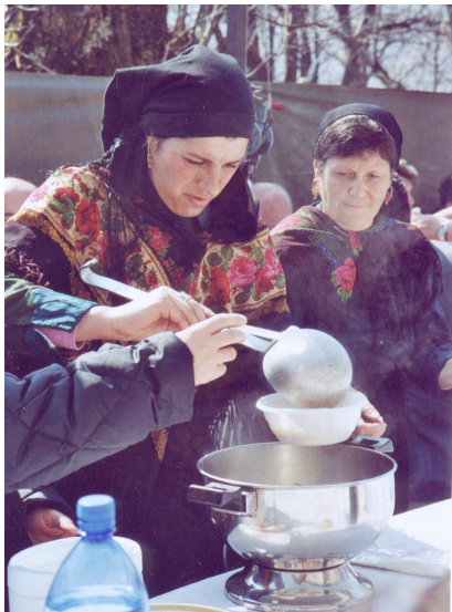
Kostuum zoals dat nu gedragen wordt in Stazzona

Dit heeft geleid tot de karakteristieke klederdracht van de vrouwen, die lijkt op de franciscaanse pij. Ze werden daarom wel frate genoemd of moncecche . Zecchinelli 2 beschrijft deze klederdracht als volgt. Het kledingstuk bestond uit stevig donkerbruin laken dat werd geweven door de Umiliate monniken in Gravedona, met een enkel fijner stuk halverwege het been, zonder manchetten en met aan de zomen een rand rood linnen. Wat later kwamen er fluwelen manchetten aan, gekleurd met biezen en geborduurde polsstukken; aan de ceintuur een heel lange strook zwart leer aan de randen afgezet met gekleurd linnen en gesloten met een grote gesp van zilver of bewerkt ijzer in de vorm van een hart; over het kledingstuk werd een wit schort gedragen. Om de hals werden vaak ringen van koraal gedragen (uit Sicilië) of kettingen met bolletjes in filigrein zilver; in de oren grote gouden spelden met de haan, wapen van Palermo of een grote R ter ere van de heilige Rosalia. Op het hoofd, boven de lange, rond het hoofd gewikkelde vlechten, droeg men meestal een ronde, platte hoed van zwart vilt met brede rand, versierd met een zwarte band met afhangende punten gesloten met drie knoopjes.